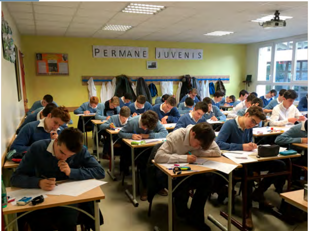
Des lycéens au travail ►

qu'il faut se poser est celle des moyens à mettre en œuvre.