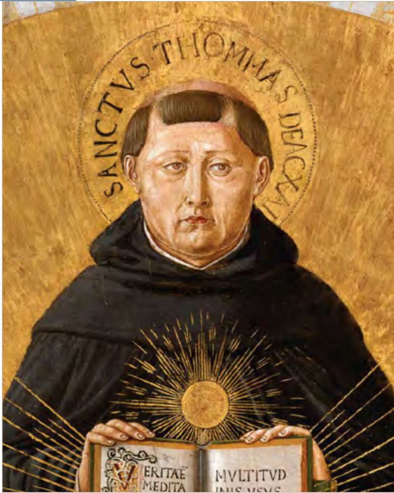
Saint Thomas d'Aquin, le docteur angélique ►

plus simple, avec la conscience plus ou moins confuse qu'ils sont censés être les premiers bénéficiaires de cette formation. C'est eux-mêmes qu'ils perfectionnent dans leurs études. La tendance existe, alors, de se rechercher soi : on étudie parce que cela